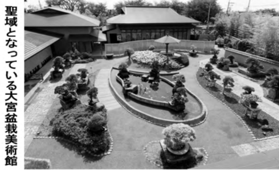
聖域となっている大宮盆栽美術館