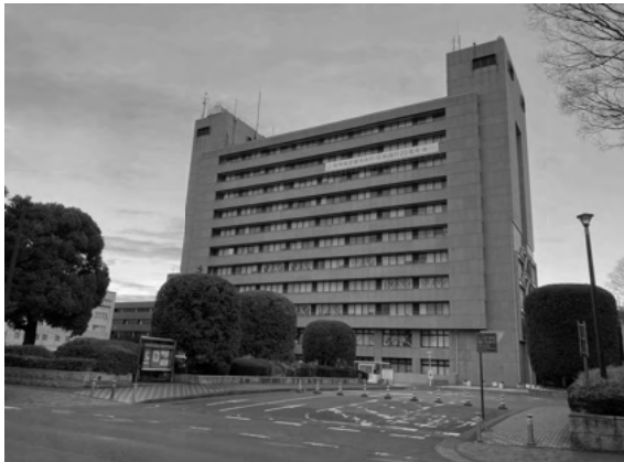
浦和の市役所の移転費が400億円に

この市役所移 転に関しては、 私は以前から 「合併促進決議」 に反する事案で あり、強く批判 してきました。