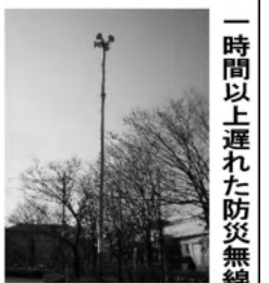
一時間以上遅れた防災無線

一方、さいたま市は1時間以上遅れた午後3時45分でした。もちろん、戸田と蕨は事件が起きた場所ですので、さいたま市と時間差が生じること自体は仕方ありません。しかし、戸田・蕨とさいたま市南部の距離を考えると、1時間以上の時間差はかかりすぎです。