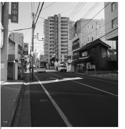
南区エリアは歩道なし

2カ所は現在工事中で歩道設置の目途がついています。一方、南区のエリアは無歩道のまま放置されています。