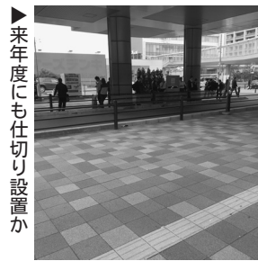
来年度にも仕切り設置が

さいたま市では新生児の聴覚検査に対し費用助成がありませんが、先進自治体では費用助成が行われています。