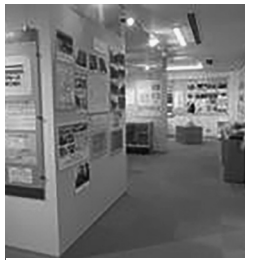
世田谷の平和資料館