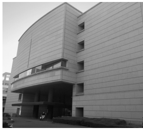
県議会も透明化が実現か

という実態、つまり、何に支出したかを確認するのに市民が容易に監視できない状況がありました。さいたま市議会では、私が紹介議員となった請願が引き金となり今年の5月分から政務活動費のネット公開が行われます。