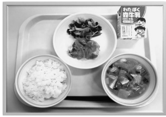
給食の充実は、子どもの未来の充実です

さて、この栄養基準の問題の背景として、食材の高騰等により現行の給食費では食材が購入できないことが大きな原因の一つとしてあります。