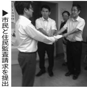
市民と住民監査請求を提出