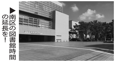
南区の図書館時間