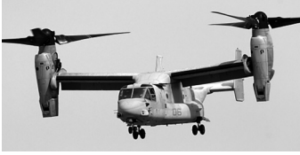
夏から横田基地配備

オスプレイは、2012年から沖縄の普天間基地に配備されました。配備後の5年間で重大事故発生率が1・7倍に上昇するなど高い事故率です。