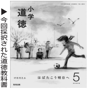
今回採択された道徳教科書