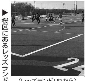
桜区にあるレッズランド