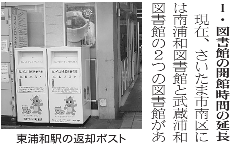
東浦和駅の返却ポスト

I・図書館の開館時間の延長 現在、さいたま市南区には南浦和図書館と武蔵浦和図書館の2つの図書館があります。