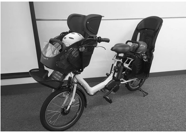
200台限定で市民に貸出

この自転車貸出は上限が200台となっており、倍率が一番高い時は13倍を超えたこともあります。