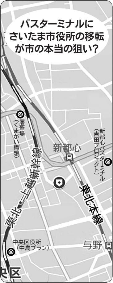
バスターミナルにさいたま市役所の移転が市の本当の狙い?

教訓を全く活かしていないことになりました。土地開発公社とは、1970年代から多くの自治体で設置された公社で開発を計画的に行うため土地を先行取得するための機関です。