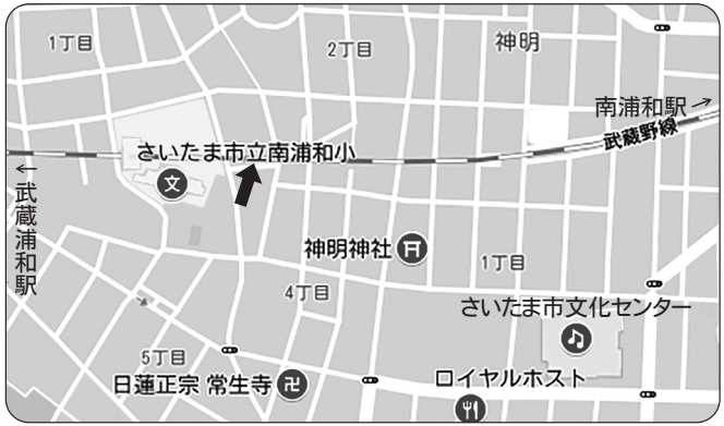
↑印が武蔵野線の防音カバーの該当場所

南浦和小学校の東側に武蔵野線の防音カバーがあります。設置から長い年月がたち、表面がポロボロになっていきます。カバーにはアスベストが使用されており、アスベストが飛散していないかJRへ調査を依頼するよう市に要求しました。