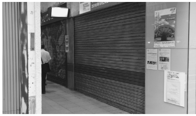
商店街の入口 右下に小さく広報のポスターがある

今回、私は市民生活委員会でナカギンザ商店街の市の対応を確認しました。そこで明らかになったのは対応の遅さです。通報があった今年3月3日から、緊急の対応として天井にブルーシートを張り落ちないよう対策を取ったのが5月