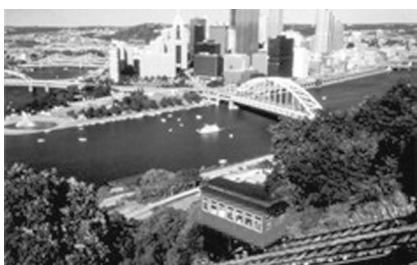
大名旅行が行われたピッツバーグ市