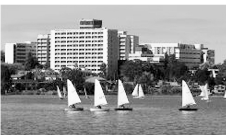
視察が中止になったハミルトン市

後行われた韓国・水原市への視察では、市長と議長は視察費用が公費で賄われたものの、その他随員の議員は請願の効果もあり、自費で行くことになりました。自費参加となった議員は、普段は自民、公明、民進改革(当時は民主改革)の3会派が参加するケースが多かったのに、今回は自民の議員だけでした。透明化をさいたま市会でも情報公開の徹底を この2つの事例は、請願自体は否決したものの、請願が提出されたことで世論の影響を考え、以前は参加していた議員が縮小・自粛したものと云えます。また、今まで参加していた議員自身が、海外視察の必要性がない、と考えている証拠とも言えます。そのため、請願を否決されても効果はあったといえます。ただ、議論を義務づける制度を設けておかなければ、「喉元過ぎれば熱さ忘れる」ではありませんが、再び内容のない海外視察で公費が浪費されることに繋がりがかねません。公金で賄われ、市民の期待と信頼を担う市議会に不透明な体制は許されません。私は、今後も海外視察の説明責任を明示するよう闘います。