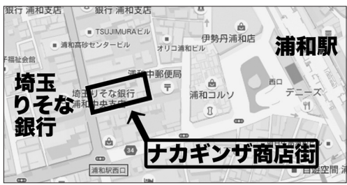
(グーグルマップより作成)

環境共生部長 対応は十分だとは思っていないが、最善の努力をさせていたところ。告知方法については、ナカギンザ商店会に見やすい場所に掲示するように求め、努力していく。