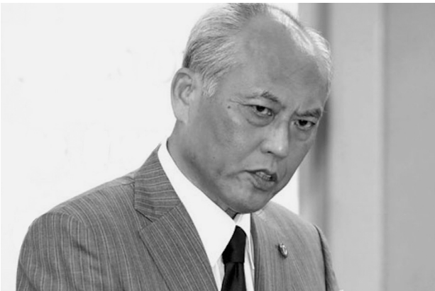
舛添前都知事の豪華な海外視察は問題となったのに...

東京都では、舛添前知事の公私混同と言われる政治資金の使用が問題になり、辞任にまで至りました。問題の発端は、舛添前知事がパリ等への5泊の海外視察に約5000万円もの巨額な費用を充てたことで